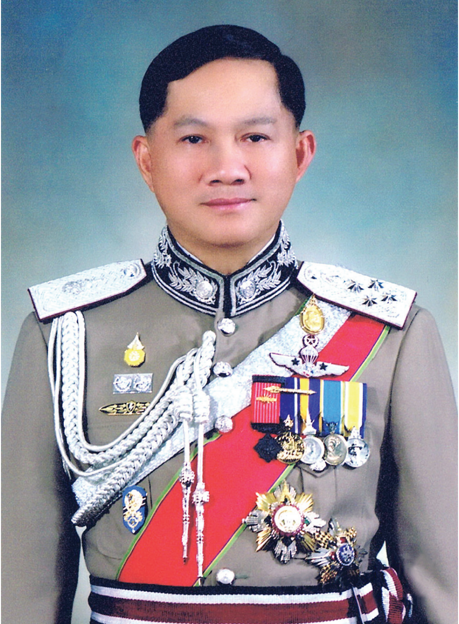
พลตำรวจเอก อุดุลย์ แสงสิงแก้ว ผู้บัญชาการตำรวจแห่งชาติ